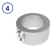
Stelling mit Gewindestift M10