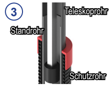
③ 3-fach Teleskop