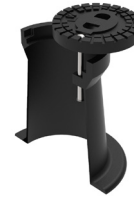
Straßenkappe ähnlich DIN 4057