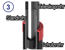
③ 3-fach Teleskop