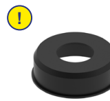
⑨ Glockendichteinsatz (optional)