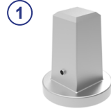
① Vierkantschoner SW27/32