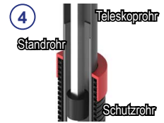
④ 3-fach Teleskop