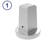
① Vierkantschoner SW27/32