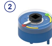
② Räderzeigerwerk aus Kunststoff