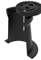
Straßenkappe ähnlich DIN 4057