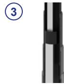
③ 4-fach Teleskop