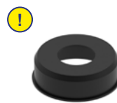
! Glockendichteinsatz (optional)