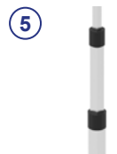
⑤ 2-fach PLUS-Sicherung