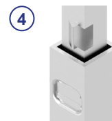
④ Auszugssicherung 150N gem. DVGW GW336