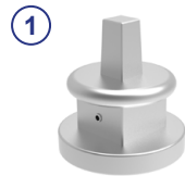
① Vierkantschoner SW12/14 gem. DVGW GW336