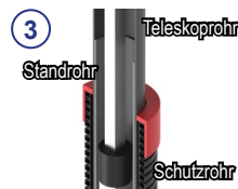
③ 3-fach Teleskop