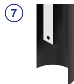
⑦ Vierkantstahl mit Bohrung gem. DVGW GW336