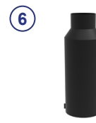
⑥ Rundglocke gem. DVGW GW336