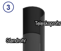
③ 2-fach Teleskop